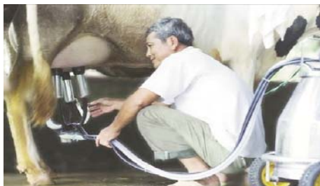
Vắt sữa bò bằng máy cho chất lượng sữa cao

Thực hiện đề án: “Tăng cường trang thiết bị phục vụ cơ giới hóa ngành chăn nuôi bò sữa năm 2016”, mới đây, Trung tâm Khuyến nông TPHCM (TTKN) đã tổ chức bàn giao hàng trăm máy móc, thiết bị trong chăn nuôi bò sữa cho nông dân (ND) huyện Củ Chi.