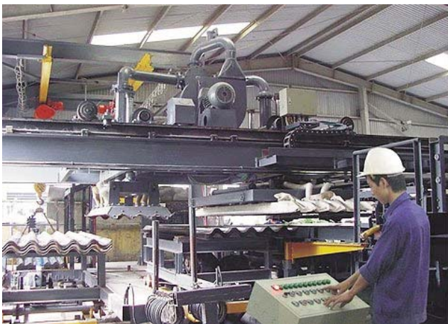
Công nhân Công ty Cổ phần Sản xuất - Thương mại Tân Thuận Cường đang vận hành với dây chuyền công nghệ mới

Theo các chuyên gia có mặt tại hội thảo “Lộ trình ngừng sử dụng amiang tại Việt Nam vào năm 2020 và các cam kết quốc tế” do Liên hiệp các Hội KH&KT Việt Nam và Mạng lưới cấm sử dụng amiang tại Việt Nam tổ chức vào ngày 16/3, Việt Nam đã thành công trong việc nghiên cứu vật liệu, giải pháp công nghệ, thiết bị, mô hình sản xuất sản phẩm không amiang trên quy mô công nghiệp từ khá lâu. Nhiều nước đã học hỏi và áp dụng kinh nghiệm này của Việt Nam. Các chuyên gia cũng khẳng định, từ nay tới năm 2020 cần tập trung tuyên truyền cho người dân thấy tác hại của amiang; hỗ trợ những vật liệu không amiang; kiểm soát chặt môi trường lao động các cơ sở sản xuất các sản phẩm có liên quan đến amiang. T.HÀ