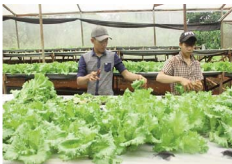
Cắt rau thủy canh tại vườn

Mô hình trồng rau sạch bằng phương pháp thủy canh hồi lưu ở xã Bình Sơn, huyện Phú Riềng, Bình Phước là trồng trực tiếp vào vỉ xốp thay vì trồng dưới đất như những loại rau khác, phía dưới là lớp mùn cưa. Khi nảy mầm, rau được đưa lên luống, có hệ thống phun tưới tự động "2 trong 1", không sử dụng thuốc bảo vệ thực vật và phân hóa học.