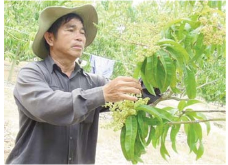
Vườn xoài trở hoa xum xuê

Để cho quả xoài vỏ đẹp, sáng sạch để bán được giá cao thì khi quả xoài đạt cỡ trung bình, cần tỉa cành lá xung quanh cho